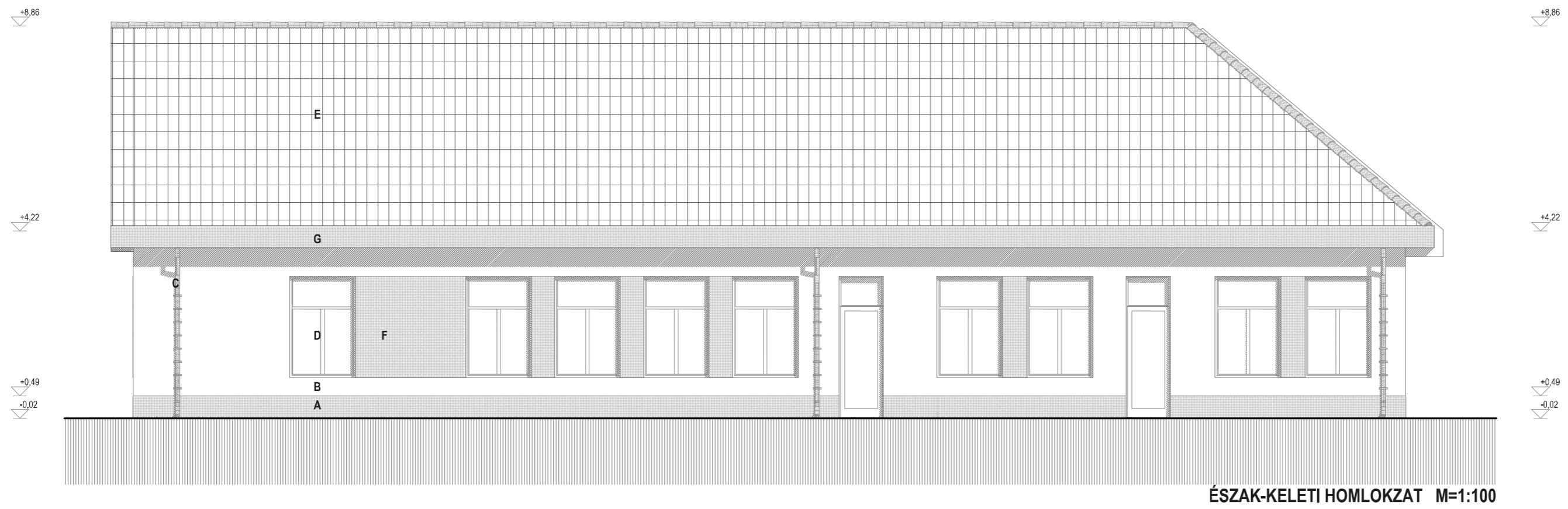
ÉSZAK-KELETI HOMLOKZAT M=1:100